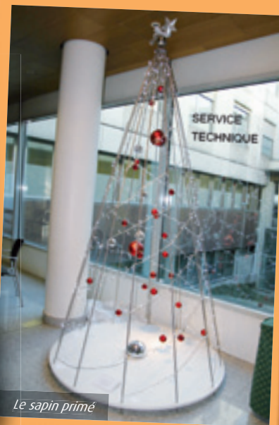
Le sapin primé

À Noël 2012, le traditionnel concours de sapin de Noël a été remporté par l'équipe technique de la clinique du Diaconat Roosevelt avec un sapin audacieux et très moderne. Bravo à elle et bonne chance pour les autres services pour le concours 2013 !