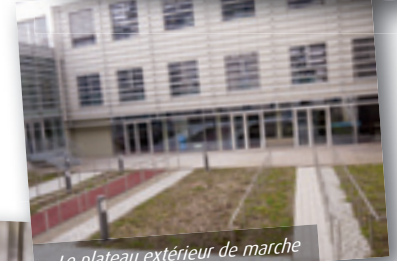
Le plateau extérieur de marche