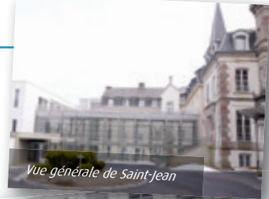
Vue générale de Saint-Jean