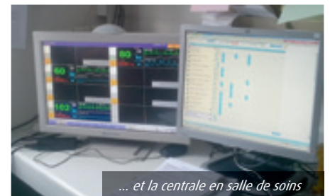
... et la centrale en salle de soins

Enfin, et je tiens à les en remercier très chaleureusement, les équipes de chirurgie B et D ont fait preuve d'une très grande réactivité car en début d'année, il s'est avéré nécessaire de permuter ces services en raison des polypathologies accueillies en USC tiède. Sans la disponibilité et la capacité d'adaptation des personnels soignants, toute cette réorganisation n'aurait pas fonctionné et il faut vraiment les saluer. ■