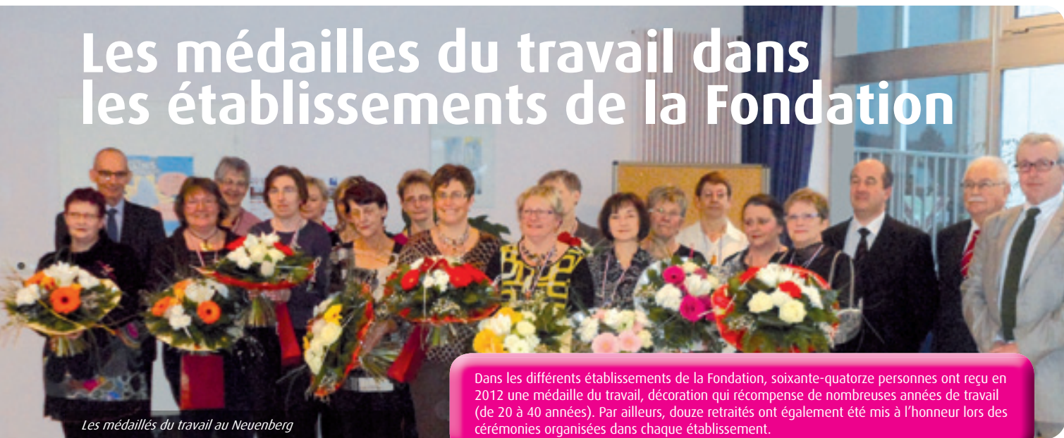
Les médaillés du travail au Neuenberg

Dans les différents établissements de la Fondation, soixante-quatorze personnes ont reçu en 2012 une médaille du travail, décoration qui récompense de nombreuses années de travail (de 20 à 40 années). Par ailleurs, douze retraités ont également été mis à l'honneur lors des cérémonies organisées dans chaque établissement.