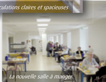
La nouvelle salle à manger