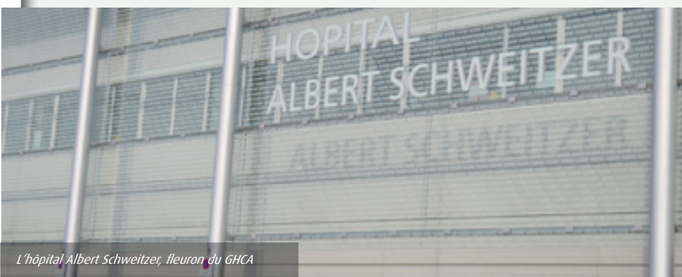
L'hôpital Albert Schweitzer, fleuron du GHCA