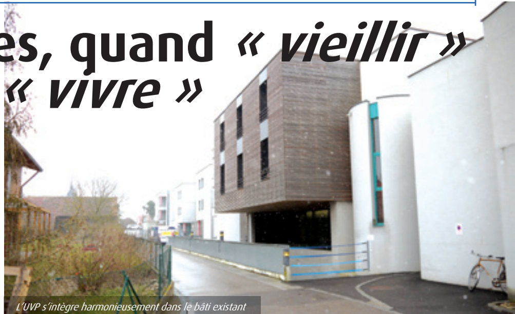
L'UVP s'intègre harmonieusement dans le bâti existant

L'autre objectif des travaux, qui se réalise par un réaménagement complet de la structure, vise à adapter