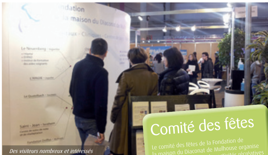
Des visiteurs nombreux et intéressés

Le Salon Régional Emploi Formation (SRFE) est l'occasion pour la Fondation de présenter ses formations, ses métiers et son activité. Cette année encore, le public était nombreux (environ 22 000 personnes) à déambuler dans les allées du Salon.