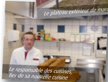
Le responsable des cuisines, fier de sa nouvelle cuisine