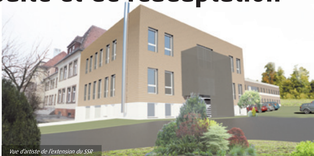
Vue d'artiste de l'extension du SSR

Le bâtiment aura deux niveaux, mais une phase ultérieure d'extension sera rendue possible en prévoyant déjà la possibilité de la construction d'un troisième niveau en fonction des besoins futurs. Un recrutement d'environ vingt-cinq équivalents temps pleins est prévu dans le cadre de cette extension. Avec trois-cent-deux lits, le Neuenberg deviendra l'établissement le plus important de la Fondation en terme de capacité d'accueil.