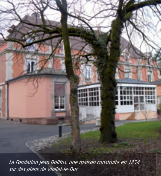
La Fondation Jean Dollfus, une maison construite en 1854 sur des plans de Viollet-le-Duc

Elle abrite à présent cent-six résidents et offre notamment quatre places d'hébergement temporaire, quatorze places en Pôles d'activités et de soins adaptés (PASA) et onze place d'unité de vie protégée. La Fondation Jean Dollfus est l'un des premiers établissements de la région à prendre en charge des patients touchés par la maladie d'Alzheimer. La durée moyenne de séjour y est de 3 ans et demi, la moyenne d'âge des résidents est de 87 ans, la répartition est de 75% de femmes et de 25% d'hommes. Aujourd'hui, ce sont quatre-vingt-dix-huit salariés, toutes qualifications confondues, qui prennent en charge les cent-six patients.