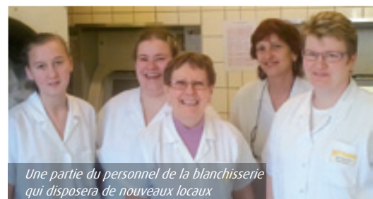
Une partie du personnel de la blanchisserie qui disposera de nouveaux locaux

après le retour à domicile pour éviter le cycle de réhospitalisation pour insuffisance respiratoire. ■