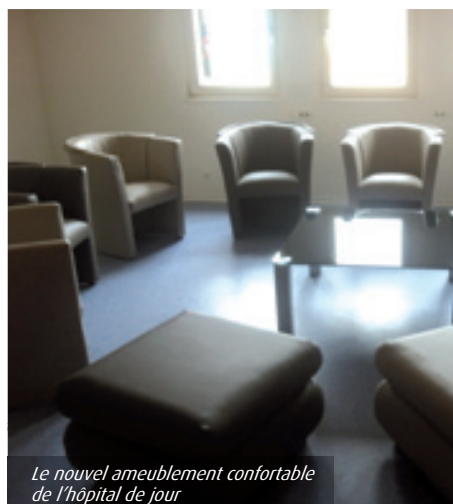
Le nouvel ameublement confortable de l'hôpital de jour

Le repas est toujours accompagné d'un encadrement pour développer le lien thérapeutique. Un lien qui est très important parce qu'il crée les conditions de confiance pour que les choses puissent être dites. Il faut pouvoir dire son échec éventuel, cela vaut mieux que de le cacher. Après le repas, un temps de détente et, à 14h, reprise des activités avec notamment le point info addiction jusqu'à 16h où une reprise en groupe permet de faire le bilan de la journée et de prendre conscience que l'on fait partie d'un groupe, d'une entité motivante dont la condition est l'abstinence.