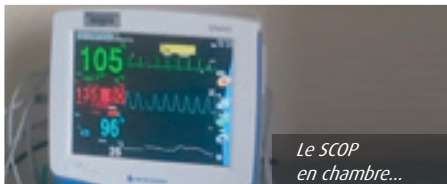
Le SCOP en chambre...